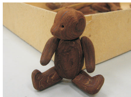
vyřezávání z kůry