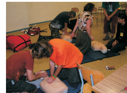
první pomoc, resuscitace