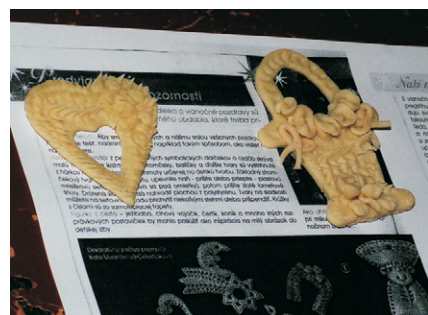
vizovické pečivo a perníčky