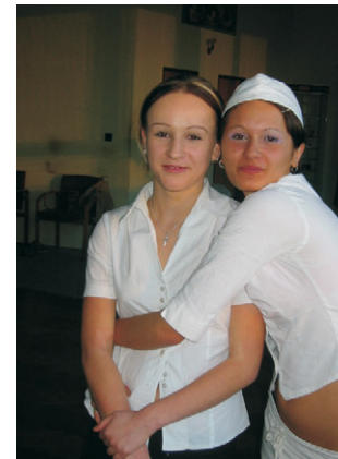
slečny z jídelny