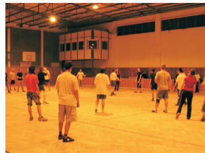
sparty v tělocvičně