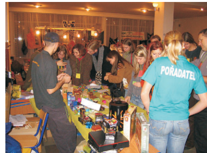
stánky s vybavením