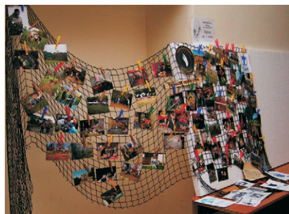
prezentace oddílů a sdružení