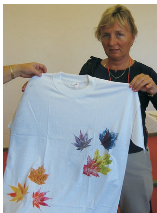
obtisky na triko