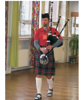
dudák ze sdružení Skotský pes