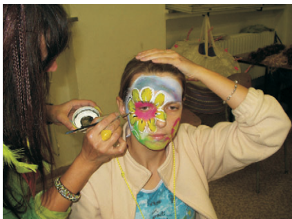
malování na tvář