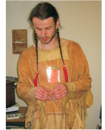
indián – Jage