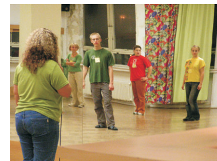
tance v baletním sále