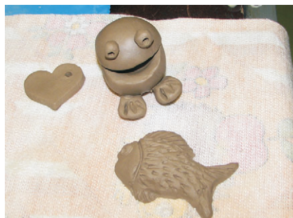
modelování z keramické hlíny